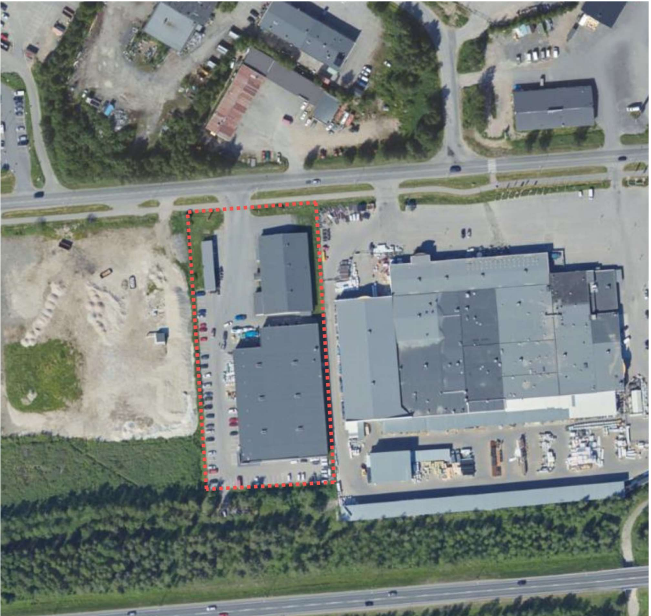
Kuva 1. Ilmakuva (2021) suunnittelualueesta

Asemakaavan muutos 9. kaupunginosa kortteli 9024 tontti 2 Teollisuustie 15