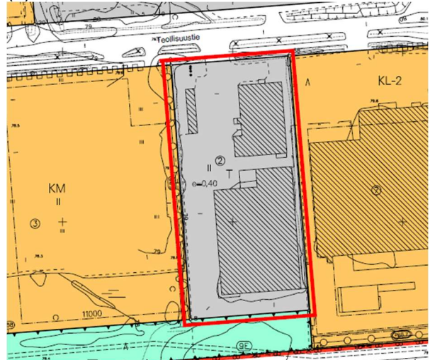
Kuva 4. Voimassa oleva asemakaava ja aluerajaus

Tontilla on voimassa ympäristöministeriön 27.04.1983 vahvistama asemakaava. Alue on merkitty voimassa olevaan asemakaavaan teollisuus- ja varastorakennusten korttelialueeksi (T). Korttelitehokkuus alueella on e=0.40 ja kerrosluku kaksi (II).