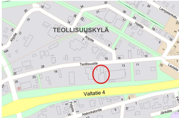
Kuva 2. Suunnittelualueen sijainti

Kaavamutosalue sijaitsee 9. kaupunginosassa osoitteessa Teollisuustie 15. Suunnittelualue käsittää korttelin 9024 tontin 2.